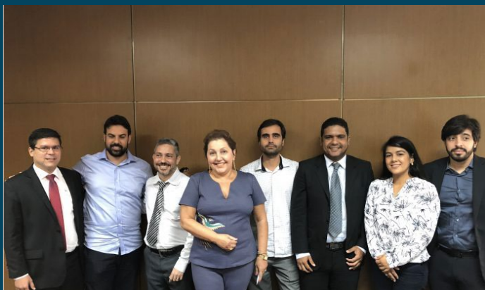
Novos servidores empossados no dia 02/05; eles fazem parte do Cadastro Reserva do Concurso regido pelo Edital 01 de 2014 – 03/05/2018