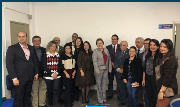
Centro Judiciário de Solução Consensual de Conflitos de Vitória da Conquista, implantado em fevereiro 2018, apresenta resultado do trabalho – 11/05/2018