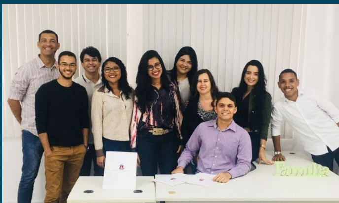
A 1ª Vara de Família de Camaçari promove o projeto “Falando em Família”, com ciclo de palestras, visando qualificar os servidores – 09/05/2018