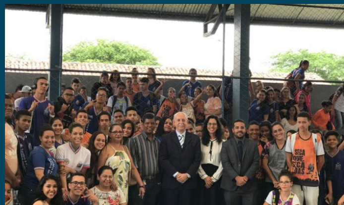
Juizado de Ipiatã cadastrou oito instituições para receber valores de transações penais e beneficiários de sanções alternativas - 25/04/2018