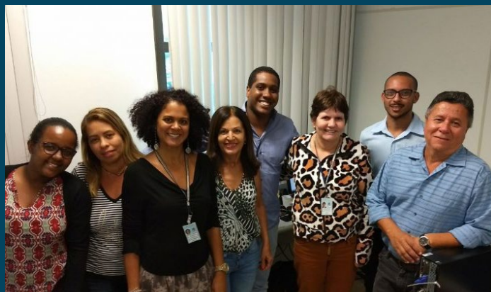
Taquígrafos do TJBA, que agora contam com novo sistema de gravação de áudio e vídeo, foram homenageados no Dia Nacional do Taquígrafo – 03/05/2018