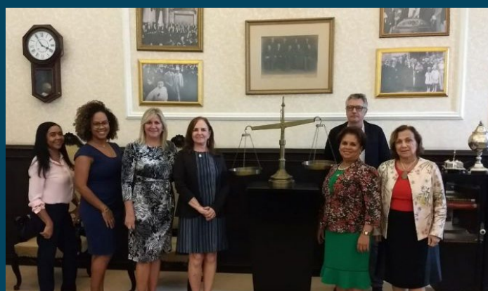
A Comissão Permanente de Memória do TJBA fez uma vistoria no Memorial do Fórum Ruy Barbosa; o local guarda acervo de 410 anos - 17/05/2018