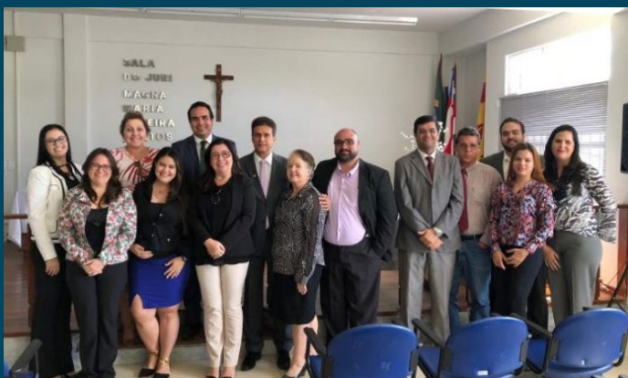
Cartórios judiciais e extrajudiciais das Comarcas de Brumado (foto), Guanambi e Vitória da Conquista receberam visita de correção da CGJ em maio – 14/05/2018