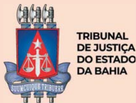
TABELA I - 2026 ATOS DOS CARTÓRIOS JUDICIAIS

LEI ESTADUAL Nº 12.373/2011 - DE 23 DE DEZEMBRO DE 2011, ALTERADA PELA LEI ESTADUAL Nº 14.806/2024, DE 26/12/2024. ATUALIZADA PELO DECRETO JUDICIÁRIO Nº 1075/2025, DE 16/12/2025 - VIGÊNCIA: 01/01/2026.