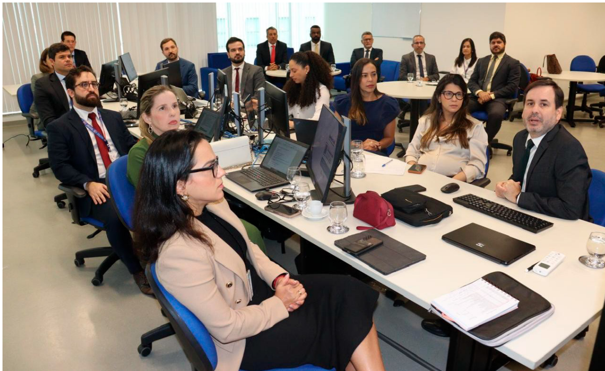
01/12/2025 - Reunião da Comissão de Transição - Apresentação