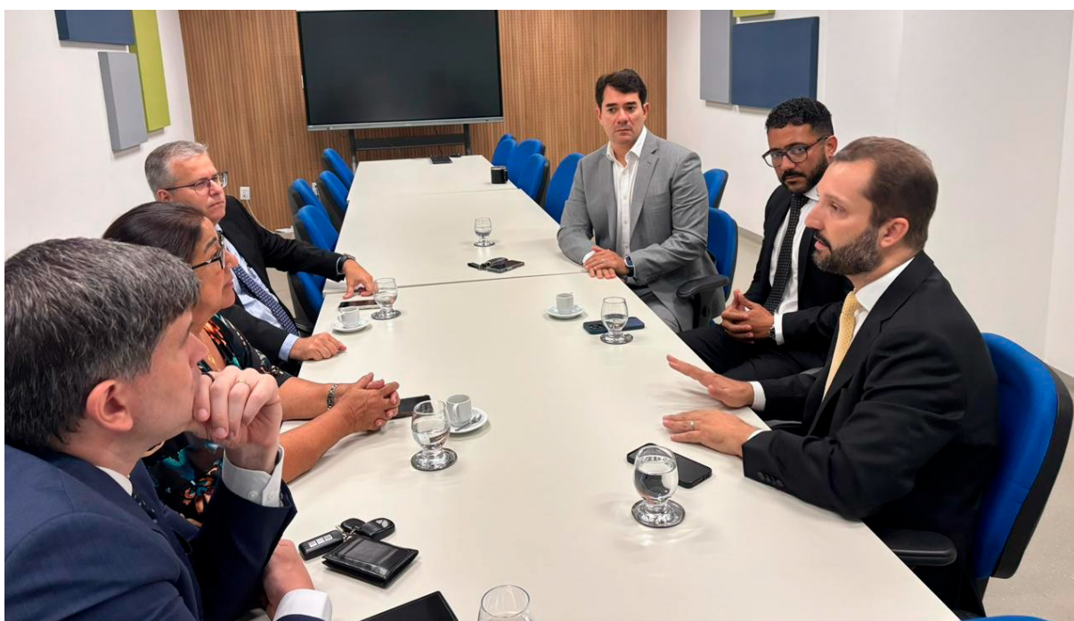
12/12/2025 - Reunião Ordinária do Comitê Estadual de Precatórios