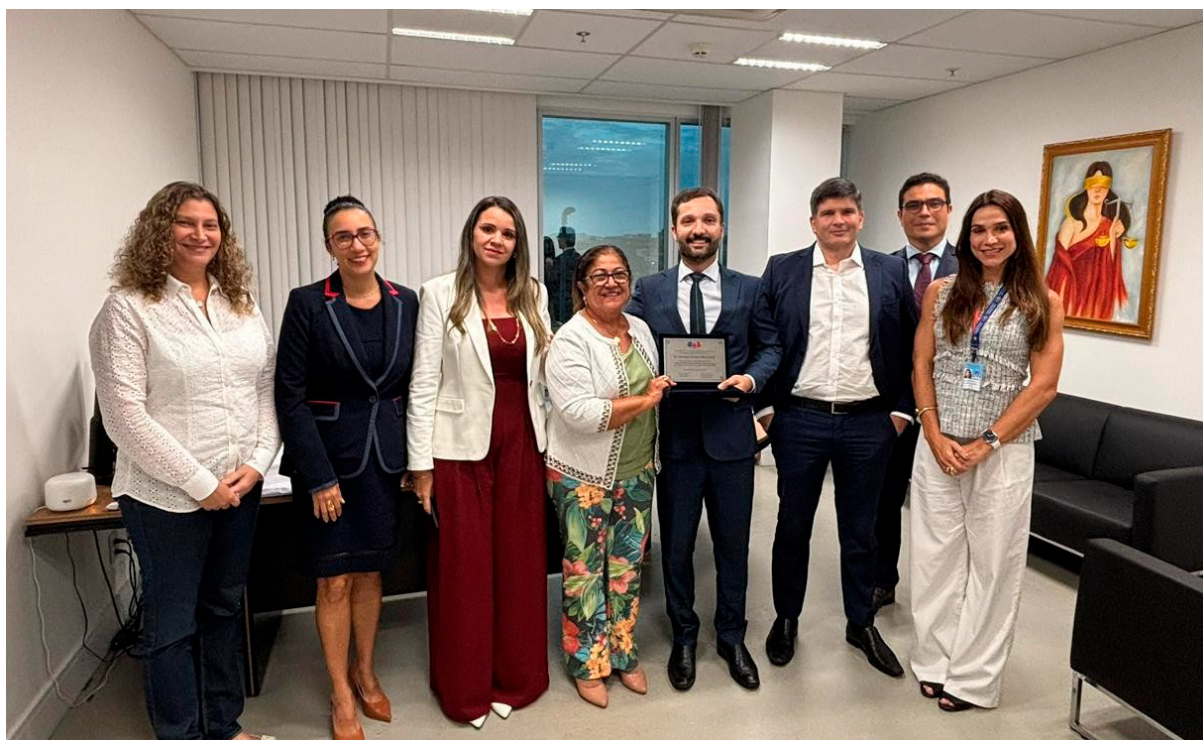
05/12/2025 - Reunião com a Comissão de Precatórios da OAB-BA