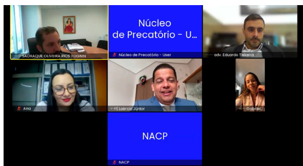
19/12/2025 - Audiência de Conciliação - Município de Senhor do Bonfim