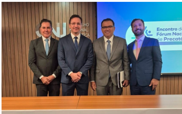
10 a 11/12/2025 - Participação no VI Encontro do Fórum Nacional de Precatórios - Brasília/DF