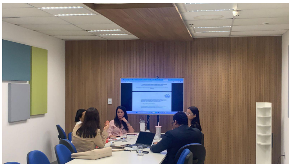
1ª Reunião do Subgrupo de Estágio com integrantes do Cartório Integrado de Consumo de Salvador.