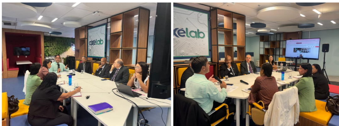
Reunião para apresentar os resultados das pesquisas.