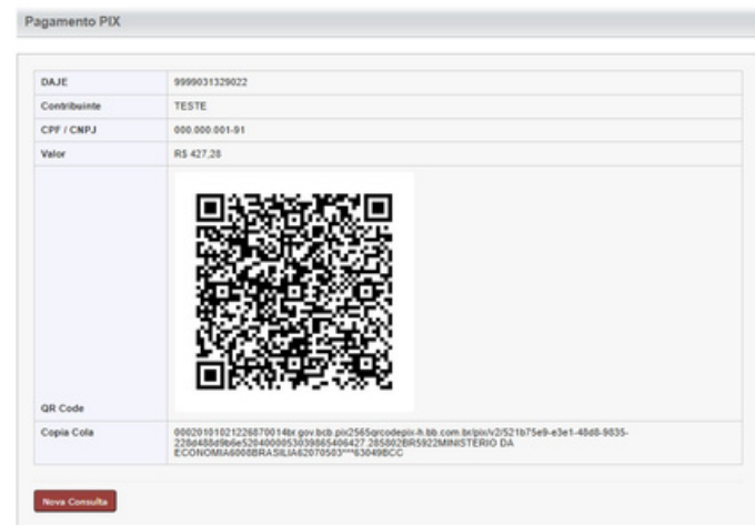
Na imagem: print de tela da implantação.