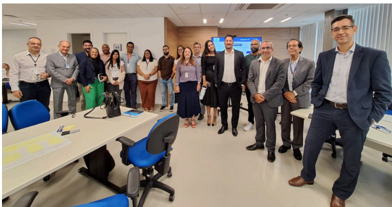
Na imagem: participantes do curso de metodologia OKR.

A SETIM segue apostando na formação continuada e valorização dos seus servidores, contribuindo assim para os objetivos institucionais do TJBA.