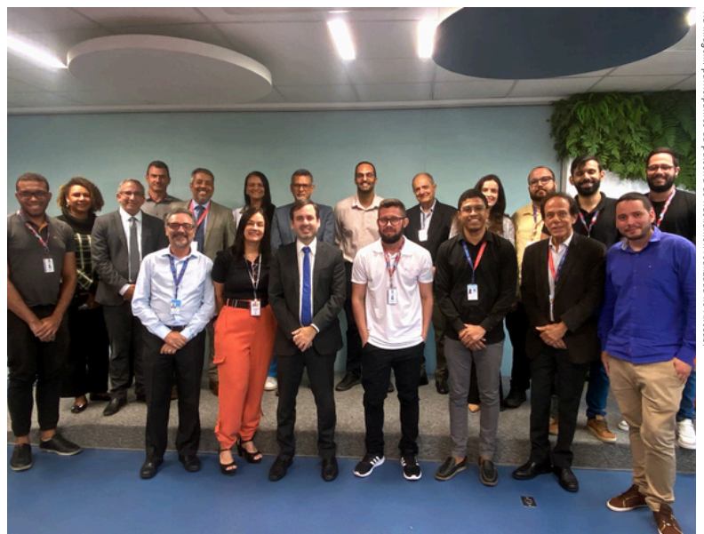
No imagem participantes do palestra de Hackathon realizado no AxéLab.

Com essa iniciativa, o Tribunal reforça seu compromisso em modernizar processos e incentivar a busca por soluções criativas e eficazes para aprimorar seus serviços e atendimentos.