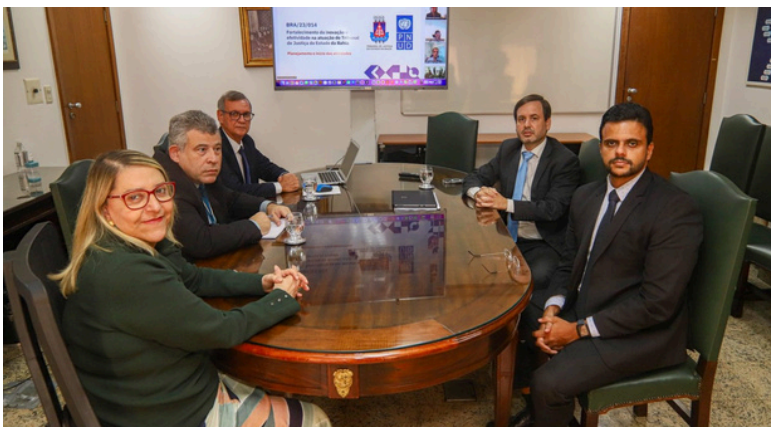
Reunião da Presidente do TJBA, com a SGP, SEPLAN, SETIM e PNUD (remoto) para discussão do projeto que visa impulsionar o tempo médio de resolução de processos. 22 de março de 2024

“Esse projeto foi consolidado neste ano e nós já iniciamos o lançamento dos editais para a contratação dos profissionais que irão fazer parte deste programa. Além da transferência de conhecimento, tudo que vai ser desenvolvido deixará um legado para o Tribunal, que trabalha para a eficiência na prestação dos seus serviços.”