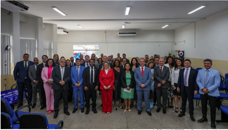
Na imagem: participantes do TJBA MAIS PERTO em Santo Antônio de Jesus.