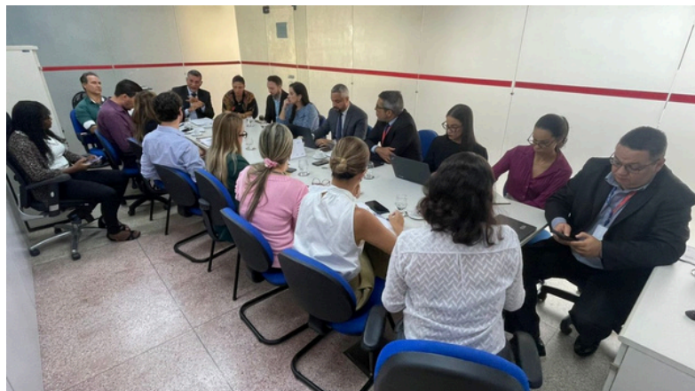
Na imagem: Grupo de Trabalho do Domicílio Eletrônico do TJBA.

Durante o encontro, realizado na Sala de Reuniões da Diretoria do Primeiro Grau (DPG), foram definidas medidas essenciais para a operacionalização dos novos sistemas, com destaque para a atuação da SETIM na criação de uma estrutura de suporte no Service Desk.