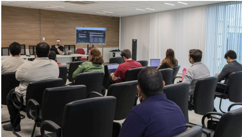
Nas imagens, participantes da capacitação.

O AxéLab, foi o responsável por promover mais uma importante iniciativa voltada à transformação digital no Judiciário baiano: o Google Day. Realizado nos dias 5 e 6 de maio, o evento reuniu especialistas, estudantes e servidores em uma imersão nas tecnologias e soluções da Google. Entre os participantes, estiveram os servidores da Secretaria de Tecnologia da Informação e Modernização (SETIM), que marcaram presença ao longo das atividades, reafirmando o compromisso da Secretaria com a inovação e a capacitação contínua.