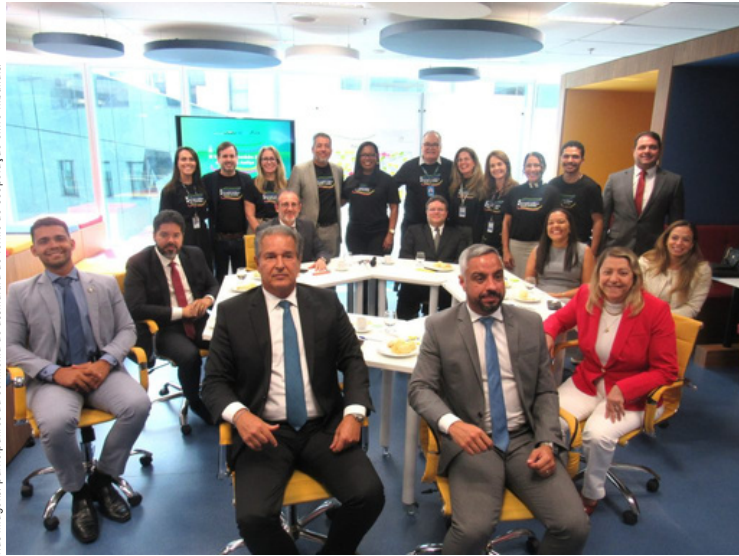
Nas imagens: participantes da cerimônia de assinatura do termo de cooperação entre tribunais.

Com foco na promoção da inovação e no fortalecimento da colaboração entre os órgãos do Judiciário, o TJBA sediou, no mês de maio, a cerimônia de assinatura do Termo de Cooperação Técnica entre o TJBA, o Tribunal Regional Eleitoral da Bahia (TRE-BA), o Tribunal Regional Federal da 1ª Região (TRF1 - Seção Judiciária da Bahia) e o Tribunal Regional do Trabalho da 5ª Região (TRT5). O evento aconteceu nas dependências do AxéLab, o laboratório de tecnologia e inovação do TJBA.