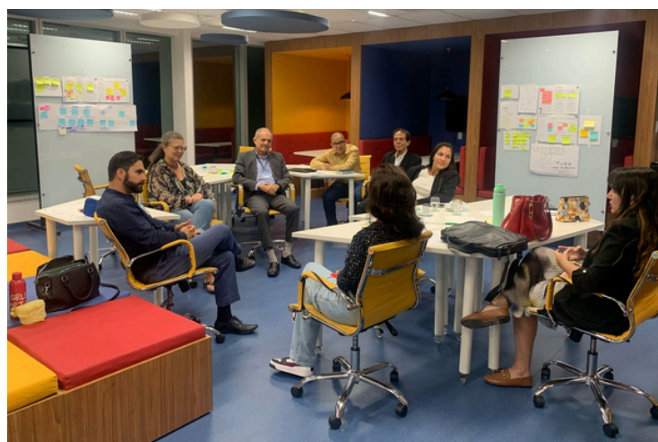
No imagem: participantes do curso de inovação e Design Thinking.