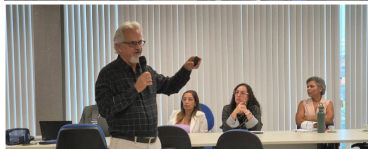
Na imagem participamos do workshop de metodologia OKR.