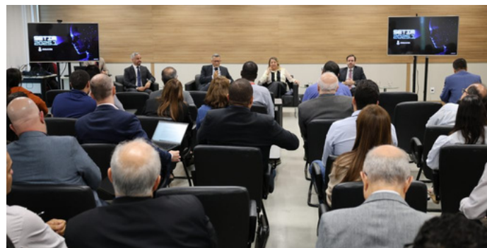
Nas imagens: participantes do encontro.

Os diretores da SETIM também compartilharam informações sobre as unidades que lideram. Na ocasião foram apresentados dados de demandas recebidas e atendidas, além de iniciativas em andamento e planejamentos futuros.