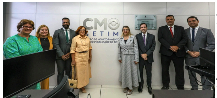
Nas imagens, participantes da cerimônia de inauguração.

“ Esta é uma área em que as pessoas não conseguem enxergar o que está sendo feito porque é feito nos bastidores, mas, hoje, tudo depende de tecnologia. Precisamos garantir a estabilidade e o desempenho contínuo do Tribunal, e o que estamos fazendo agora é elevar o padrão de resposta a incidentes de tecnologia. ”