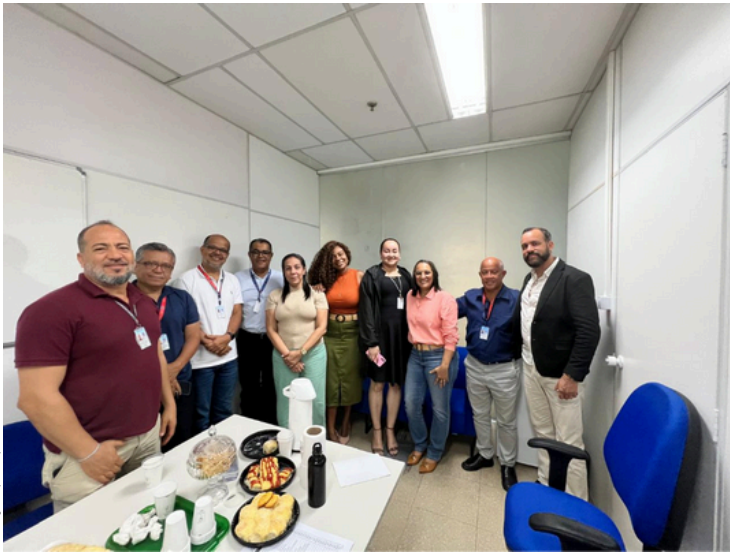
Na imagem: Participantes do reunião.

A SETIM através da Coordenação de Atendimento Técnico (COATE), promoveu um encontro estratégico com sua equipe de Fiscalização Técnica em Salvador.