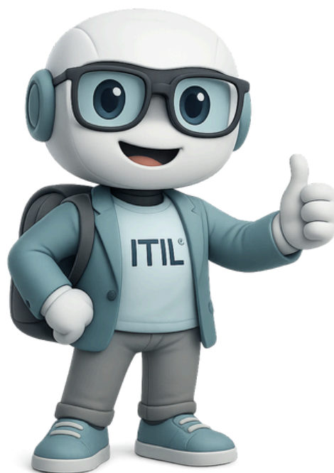
Na imagem: mascote TiGo.

Representado por um simpático robô, ele foi desenvolvido especialmente para traduzir os conceitos técnicos do ITIL de forma prática e descontraída, conectando a teoria com o dia a dia da SETIM. Seu nome é uma junção de "TI" (Tecnologia da Informação) com "Go" (agir, avançar), refletindo dinamismo e ação.