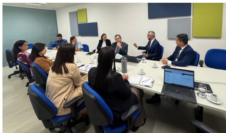
Na imagem: Membros do Comitê Gestor Interno.

Neste contexto, SETIM terá um papel fundamental. Caberá à Secretaria coordenar os aspectos técnicos da implantação, garantindo a integração do EPROC à infraestrutura tecnológica do TJBA.