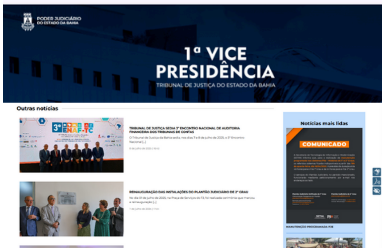
Nas imagens, participantes do evento.

A entrega foi realizada a partir de uma solicitação da própria unidade. O portal, está disponível no endereço www.tjba.jus.br/primeiravice e oferece uma estrutura moderna, acessível e de fácil gerenciamento.