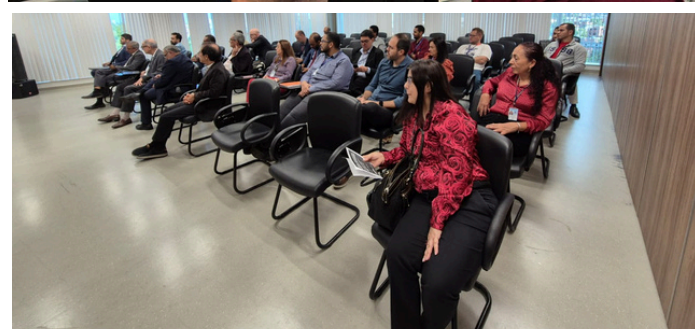
Na imagem: Participantes da palestra.