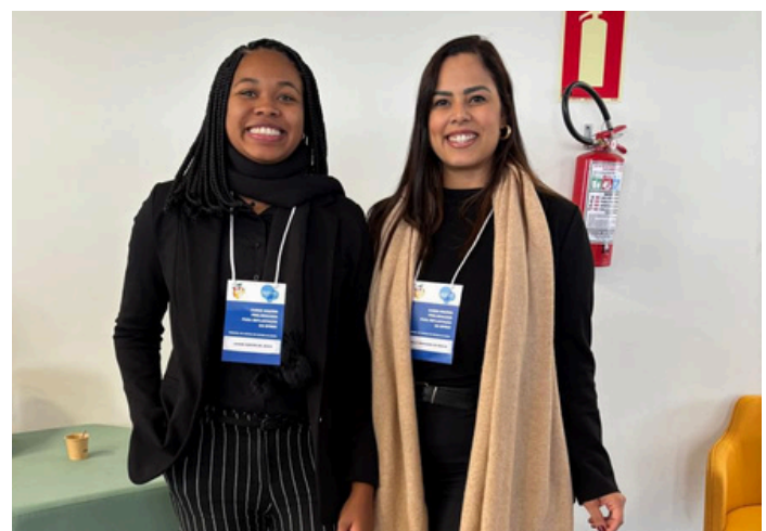
Nas imagens: equipe SETIM.