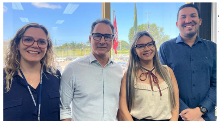
Notas imagens: equipe SETIM.

A entrega foi resultado de esforço colaborativo, diálogo constante com as equipes técnicas e jurídicas.”