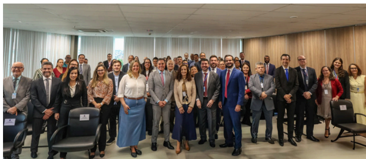
Na imagem: Participantes do evento "Conexão Orçamentária TJBA: Integrar, Planejar e Executar."

A SETIM esteve presente no evento "Conexão Orçamentária TJBA: Integrar, Planejar e Executar", realizado no auditório do TJBA. A iniciativa reuniu servidores envolvidos na execução orçamentária, promovendo um espaço de integração e alinhamento entre as unidades administrativas e judiciárias.