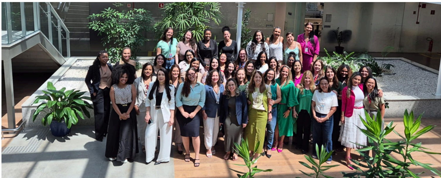
Na imagem: Mulheres da Equipe da SETIM.

Em alusão ao Dia Internacional da Mulher, celebrado em 8 de março, a SETIM destaca e reafirma a importância da participação feminina na construção de soluções inovadoras e no fortalecimento dos serviços tecnológicos do TJBA.