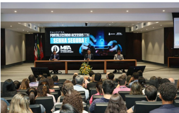
Na imagem: Palestra sobre Segurança Digital e uso do Múltiplo Fator de Autenticação.

“ Eu vejo que, cada vez mais, a SETIM está preocupada justamente com o colaborador, com quem está na ponta, com as pessoas. Essas iniciativas de sair somente da tela e trazer o público para um auditório fazem com que as pessoas se sintam parte desse processo, desse elo. A cada tentativa de ataque que chega, quando um colaborador identifica e reporta uma possível ameaça, mostra, na prática, o valor da conscientização. ”