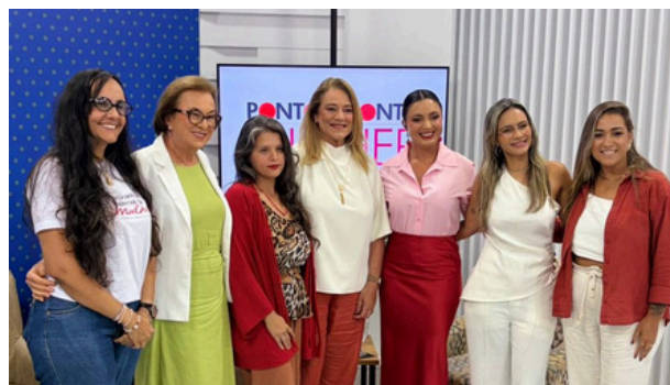
Nas imagens: Apresentação do Zela no Conselho Estadual dos Secretários Municipais de Saúde da Bahia (Cosems/BA), no Tribunal de Justiça do Estado da Bahia e na TV Alba.