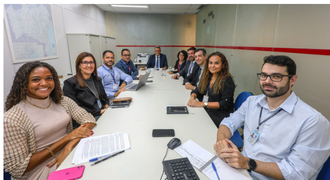
Na imagem: Reunião do Comitê Gestor do Sistema Exaudi

Entre as melhorias implementadas, destacam-se o design responsivo, a navegação simplificada e o acesso mais rápido a informações essenciais