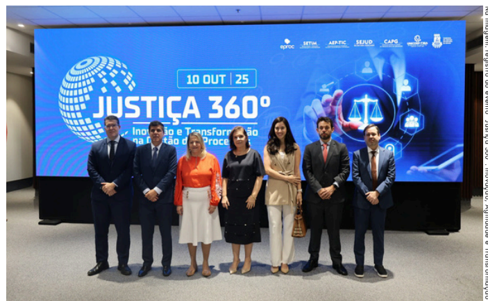
Na imagem: registro do evento “Justiça 360º: Inovação, Agilidade e Transformação”.

Durante o encontro, foram apresentadas três importantes iniciativas: o Sistema EPROC, o projeto Audiência Inteligente (AUDIN) e a Política de Inteligência Artificial (IA) do TJBA, todas elas contribuindo para o fortalecimento da inovação, da eficiência e da transparência na gestão judicial.