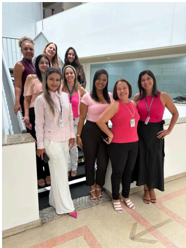
Nas imagens: servidores, estagiários e terceirizados do DMO.

Em alusão ao Outubro Rosa, a Secretaria de Tecnologia da Informação e Modernização (SETIM) promoveu um café da manhã especial voltado à conscientização sobre a prevenção e o diagnóstico precoce do câncer de mama.