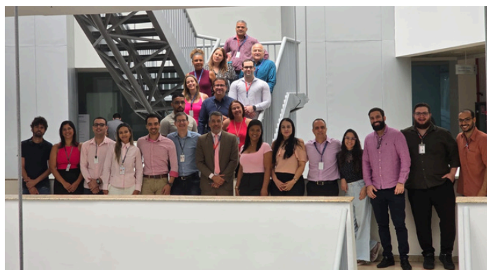
Nas imagens: servidores, estagiários e terceirizados do DMO.

O evento destacou, ainda, que a prevenção é o melhor caminho, e que falar sobre saúde é um gesto de carinho e responsabilidade.