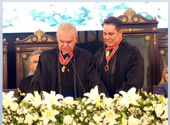
SOLENIDADE DE POSSE

Produtividade com responsabilidade, eficiência com propósito e justiça próxima de todos.