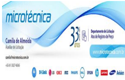
image003.jpg 16 KB