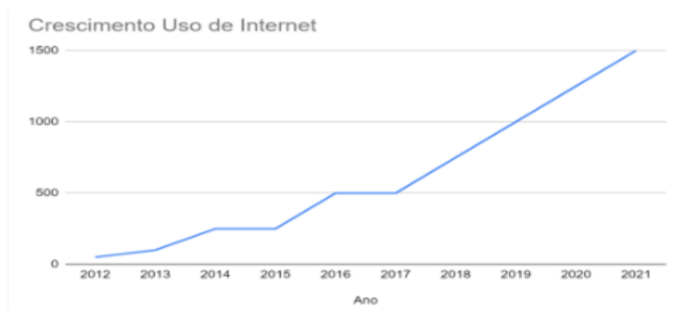
Fig.02.01 – Evolução do uso do Circuito de Internet pelo TJBA

Com base no gráfico na Figura 2.1, observa-se que vem ocorrendo um aumento gradativo e constante na demanda por largura de banda do Circuito de Internet no TJBA. Pode-se notar que esse consumo tem praticamente dobrado a cada dois anos.