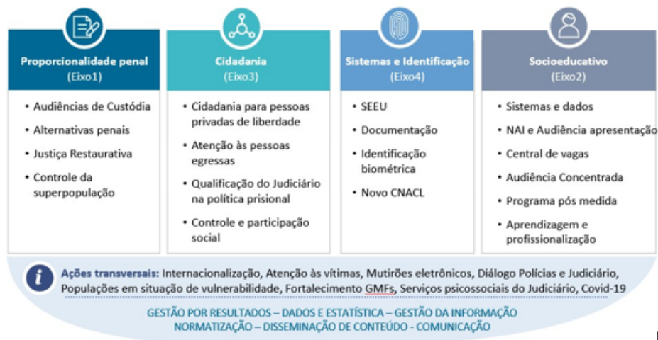
Eixos estruturantes do programa Fazendo Justiça e suas principais iniciativas