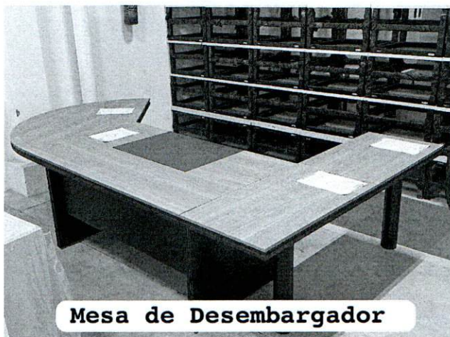
Mesa de Desembargador